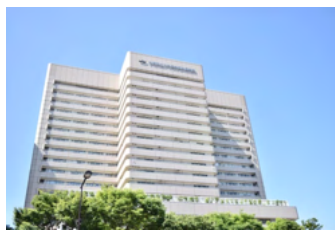
大阪市立大学医学部附属病院様

沖縄の琉球大学医学部附属病院様（沖縄県中頭郡）も、サービス開始は2019年5月と信州大学医学部附属病院様より半年遅れで