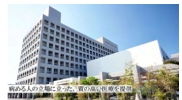
琉球大学医学部附属病院様

近年のキャッシュレス化の波にも後押しされ、あと払いの需要がここに来てますます高まっています。