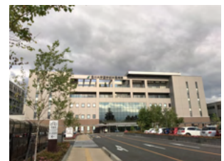
信州大学医学部附属病院様

一昨年の後半から、一日外来患者数が千人を超える大病院での外来サービスの導入が進みましたが、なかでも大学病院様でのあと払い利用が伸びています。