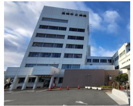
山梨県韮崎市の中核病院 外来患者数 250名/日